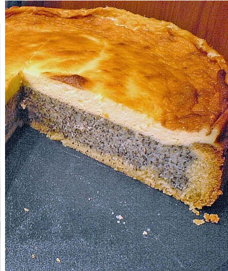
Figuur 1. Maanzaadcake welke zeer populair in Oost-Europese landen is, maar ook dicht bij huis: ook in Duitsland is maanzaadgebak een algemene lekkernij

Maanzaadstro bevat giftige stoffen afkomstig uit het melksap; het is ongeschikt voor cellulosebereiding, veevoer of strooisel. Het stro heeft daarom weinig tot geen waarde.