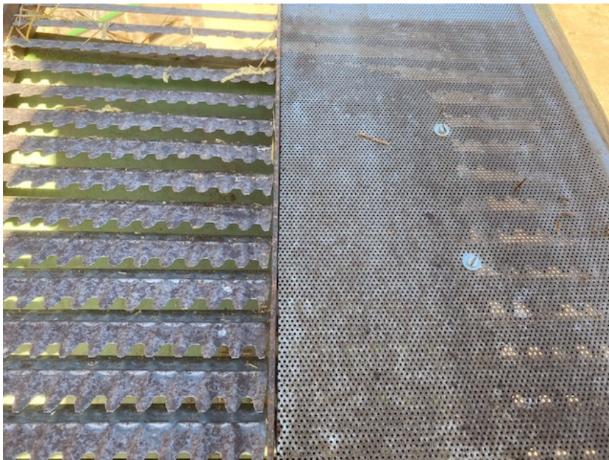
Figuur 3: Aanpassing van de bovenste zeef met geperforeerd plaatstaal.

Wie blauwmaanzaad schoon uit de combine wil hebben, kan overwegen om de bovenste zeef dicht te maken. Dit kan uitstekend met plaatstaal met perforaties van 1-1.5 mm.